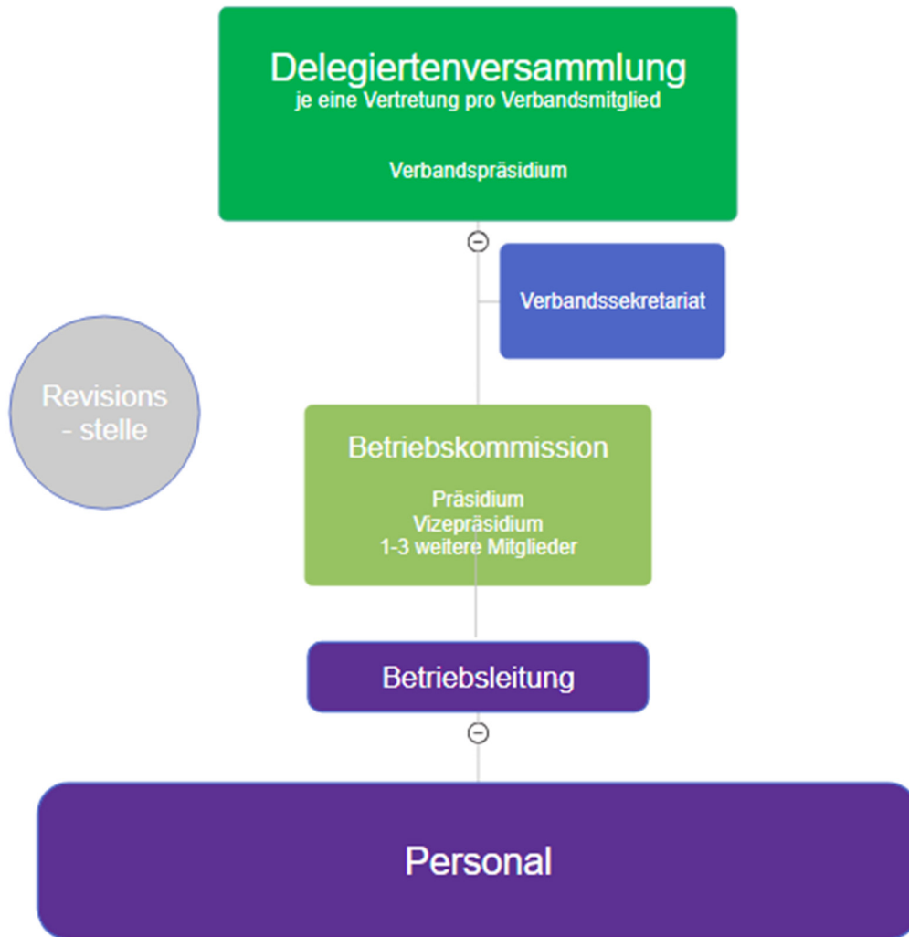
Abb. 1: Darstellung der neuen Verbandsstruktur

Oberstes Organ ist wie bereits ausgeführt die DV. Sie stellt das Verbandspräsidium, wählt die Mitglieder der Betriebskommission (mind. 3) und bestimmt deren Präsidium. Die Betriebskommission wählt wiederum die Betriebsleitung, der die betriebliche Verantwortung über die Verbandsanlagen sowie die personelle Führung der Belegschaft obliegt. Die Revisionsstelle ist grundsätzlich unabhängig, wird indes ebenfalls von der DV bestimmt.